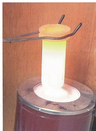
Im Ofen wird der Tiegel erhitzt und die Granalien schmelzen zu kleinen Kügelchen.

Die Herstellung der kleinen Kügelchen in perfekt runder Form ist nicht einfach. Um gleich grosse Silber- oder Goldschnipsel zu erhalten, nimmt man dünn gezogenen Draht (ca. 0,2 mm) und bündelt ungefähr zehn Drähte zu einem Strang, der dann mit einer Stellschere in immer gleichen Abständen abgeschnitten wird. Ein Schmelztiegel wird auf dem Innenboden mit Lindenholtzkohlepulver bestreut. Darauf folgt eine Lage