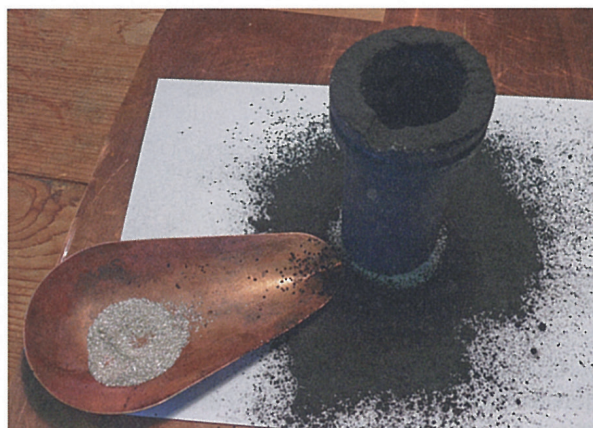
Kohlenstaub und Silberschnipsel kommen schichtweise in den Graphittiegel.

Metallabschnitte, dann wieder Holzkohlepulver bis etwa zwei Zentimeter unter den Tiegelrand. Die Metallabschnitte dürfen sich nicht berühren. Der Graphittiegel kommt in einen Schmelzofen, der auf 1200 Grad Celsius ein bis zwei Stunden lang erhitzt wird. Der Tiegel bleibt bis zum Erkalten im Ofen. Anschliessend wird der Inhalt in ein Gefäss geschüttet, das zu rund einem Viertel mit Wasser gefüllt ist. Frisches Wasser wird so lange zugegeben, bis es klar ist. Die auf dem Grund liegenden Granalien gibt man in eine Raumschale und trocknet sie mit der Flamme. Nach dem Aussortieren der unregelmässigen Granalien, wird mit dem Turmsieb nach Grösse sortiert.