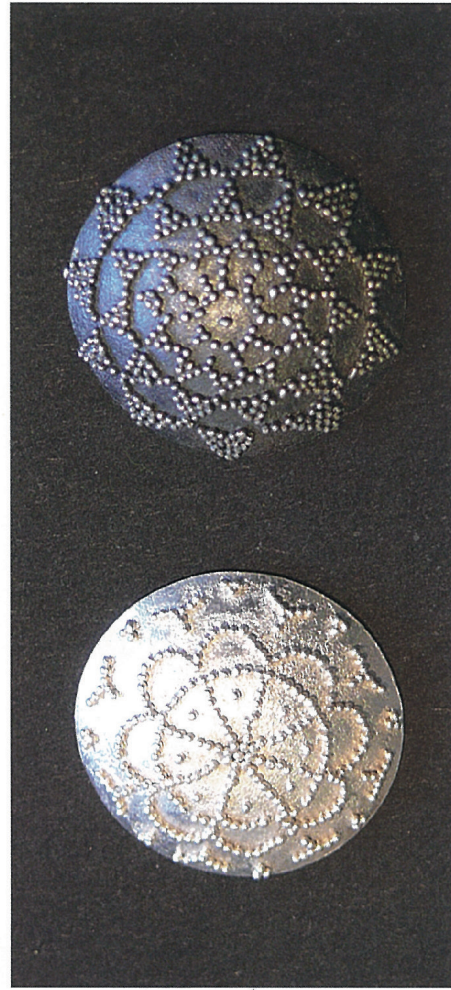
Fertige Arbeiten der Schule für Gestaltung in Basel.

Das zum Granulieren vorbereitete Schmuckstück wird mit einer weichen Flamme langsam erwärmt, bis die Oberflächen der Granalien zu spiegeln beginnen. Ein paar Sekunden muss die Temperatur so gehalten werden. Durch die reduzierende Atmosphäre wird das Kupfersalz erst in Oxyd, bei etwa 850 Grad Celsius in metallisches Kupfer umgewandelt, das sich durch die etwas niedrigere Schmelztemperatur sowohl mit den umliegenden Granalien wie auch mit dem Grundmetall verschweisst. Anschließend wird das Werkstück abgebeizt und mit einer Messingbürste gereinigt. Abgefällene Kügelchen können erneut granuliert werden. Als Abschluss wird das Schmuckstück in ein Flussmittel eingetaucht, leicht geglättet und abgebeizt. Mit dem Argentium Silber ist Granulieren noch einfacher. Im Workshop mit Ronda Coryell (22. bis 28. August in Braunwald)